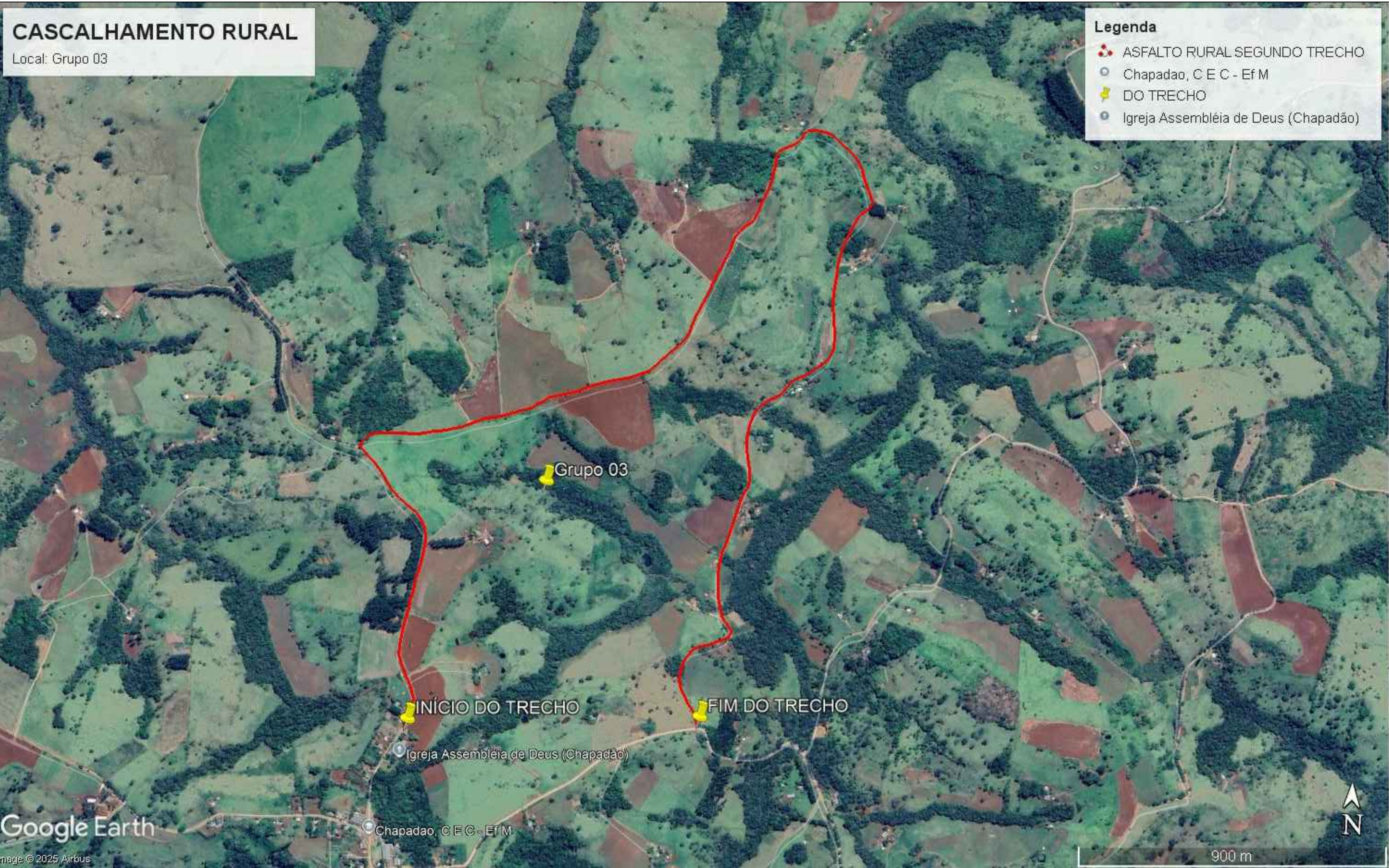
IMAGEM DE SATÉLITE